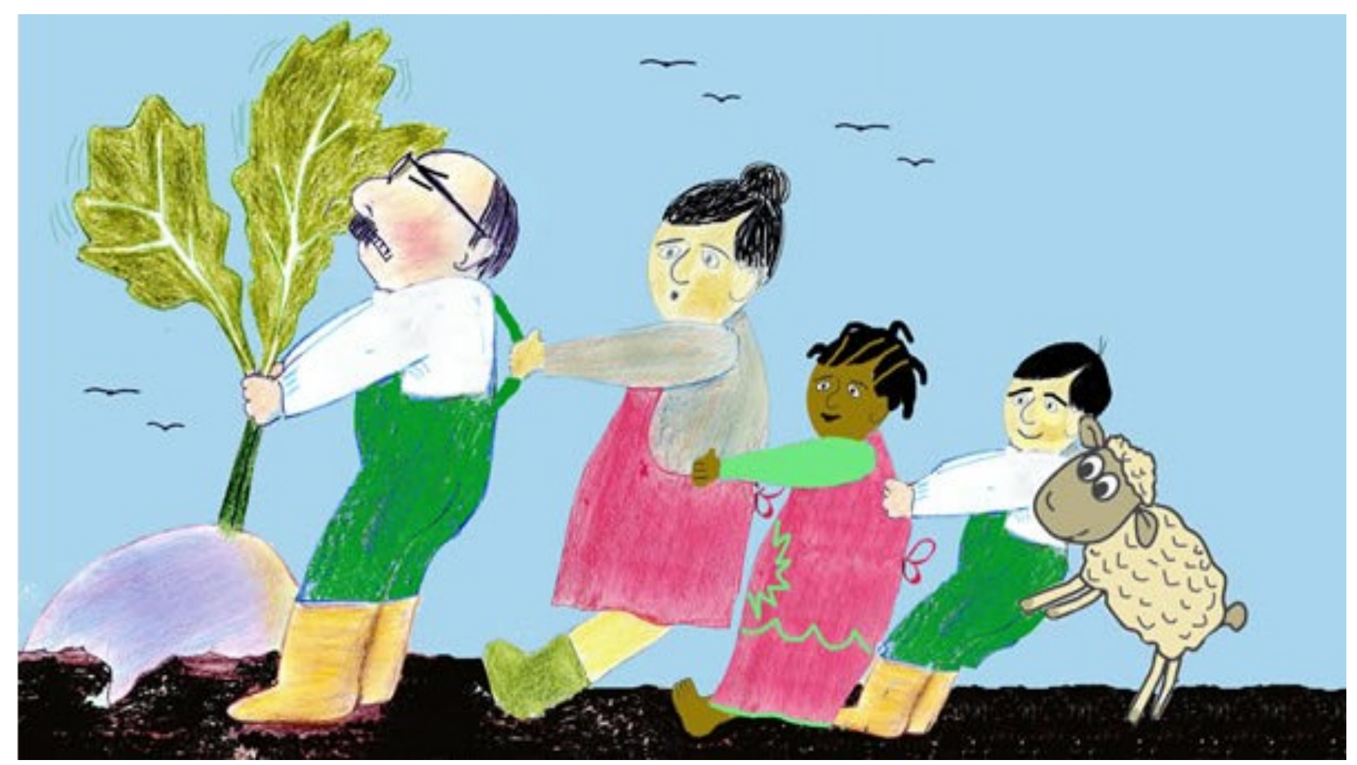
सड़ी आप है वेंडे है चहा हिंदी है। "आ अडे हिम मुस्मा धिर्ड हिरं माडी भटर बगा" बुंडा सह़बी है, सड़बी सड़बे है, सड़बा चुंदी है गरी चुंदा मुस्माम है धिरुंटा है। हैंछ पृत्रे ज़ेंग तास है म हंडे मारे मुस्माम है धिरुंटे गरे, पर्वेड्ड हैंग हिम है स्त्री धिरुंट मबरे।

The girl calls to a dog, "Come and help us pull up this enormous turnip," she says.