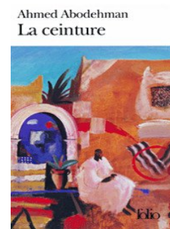
Figure 2: couverture de la collection Folio.

La couverture de la version « Folio » présente une peinture de l'artiste orientaliste Charlie Baird. Cette peinture s'intitule Kasbah Sound et a été faite au Maroc.